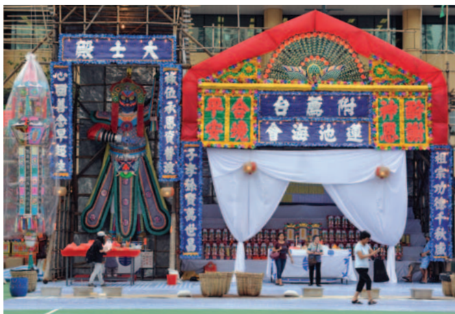
大士台(左)和孤魂台及附薦台(右)