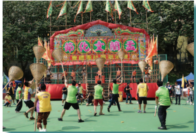
孟蘭文化節中的搶孤比賽