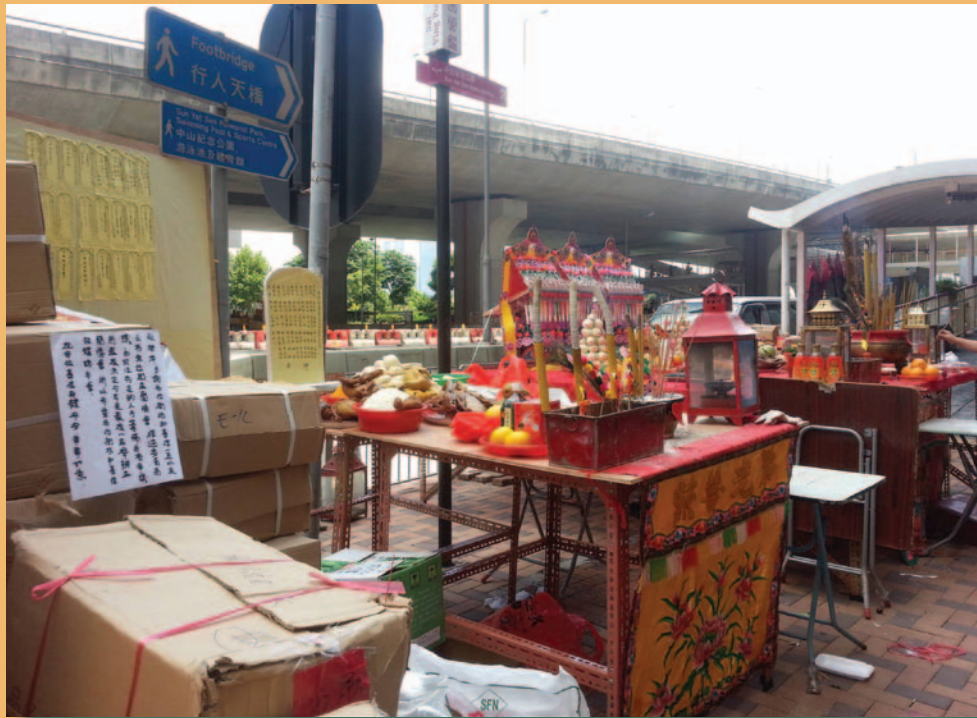
最後一屆渣甸橋東邊街街坊孟蘭勝會，中間為神壇、左方為孤魂台和附薦台，以及停辦通告。