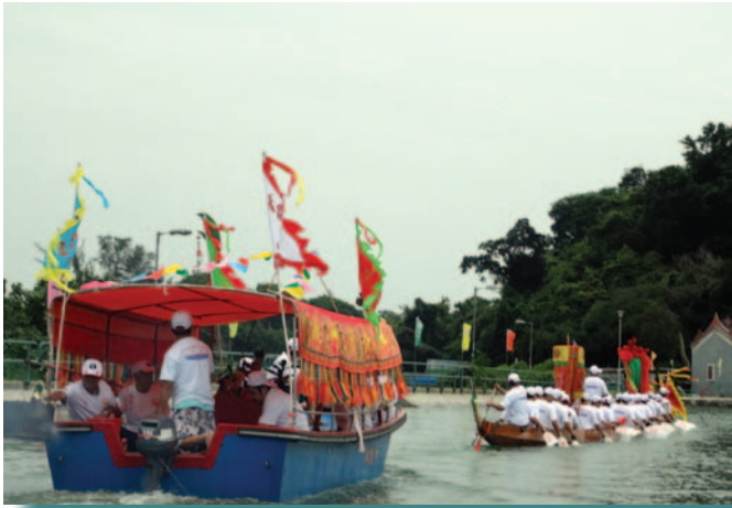
神艇上的行會成員會為水幽化衣