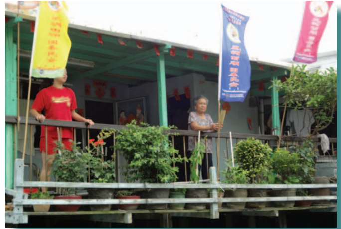
沿岸棚屋的居民拜祭經過的龍舟