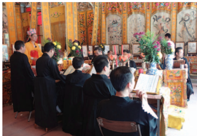
經師於經師棚頌經