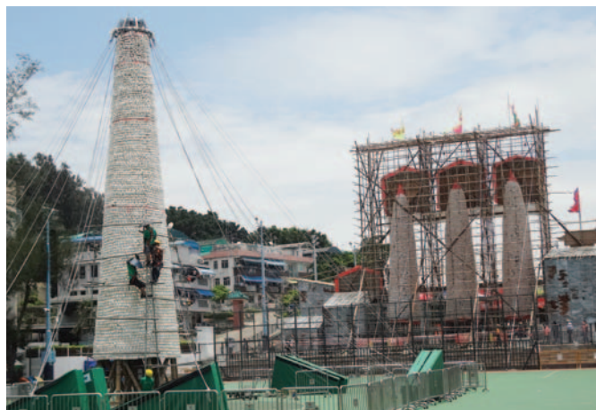
祭幽用包山(右)、「搶包山」比賽用包山(左)